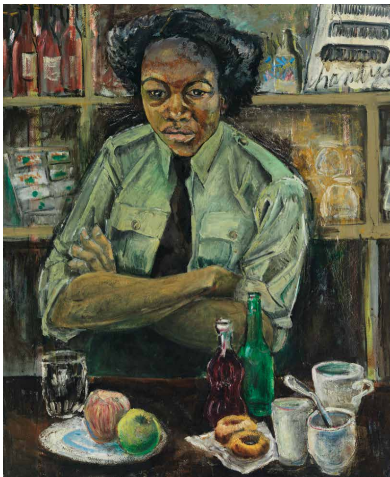
Peinture de Molly Lamb Bobak, 1946 Première femme nommée artiste de guerre au sein de l'armée canadienne