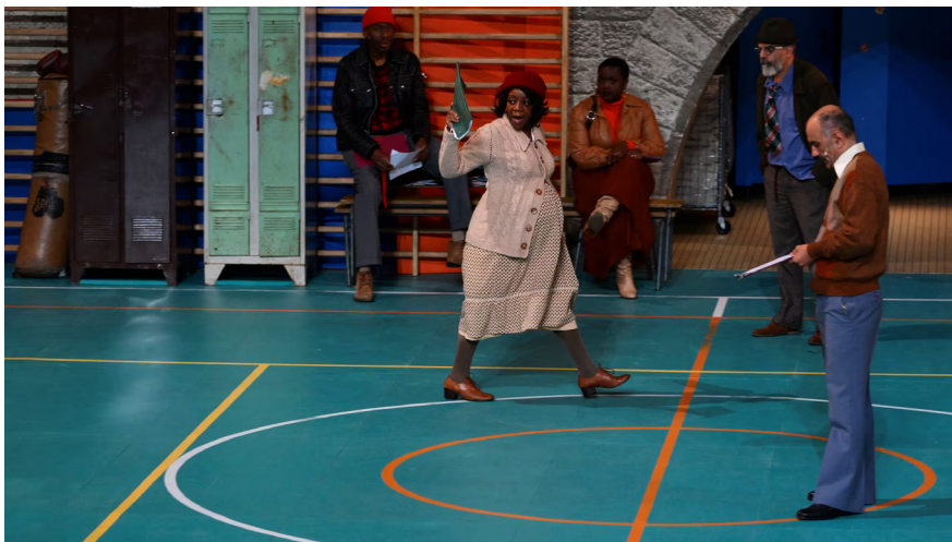
Les comédiens du spectacle d'ouverture du 77 e Festival de théâtre d'Avignon, «Welfare», se produisent sur scène au Palais des Papes lors d'une répétition générale le 3 juillet 2023

Julie Deliquet a ouvert la 77 e édition du festival d'Avignon avec Welfare du réalisateur américain Frederick Wiseman. Une plongée longue et difficile dans le quotidien des bénéficiaires de l'aide sociale, reflet de la misère humaine.