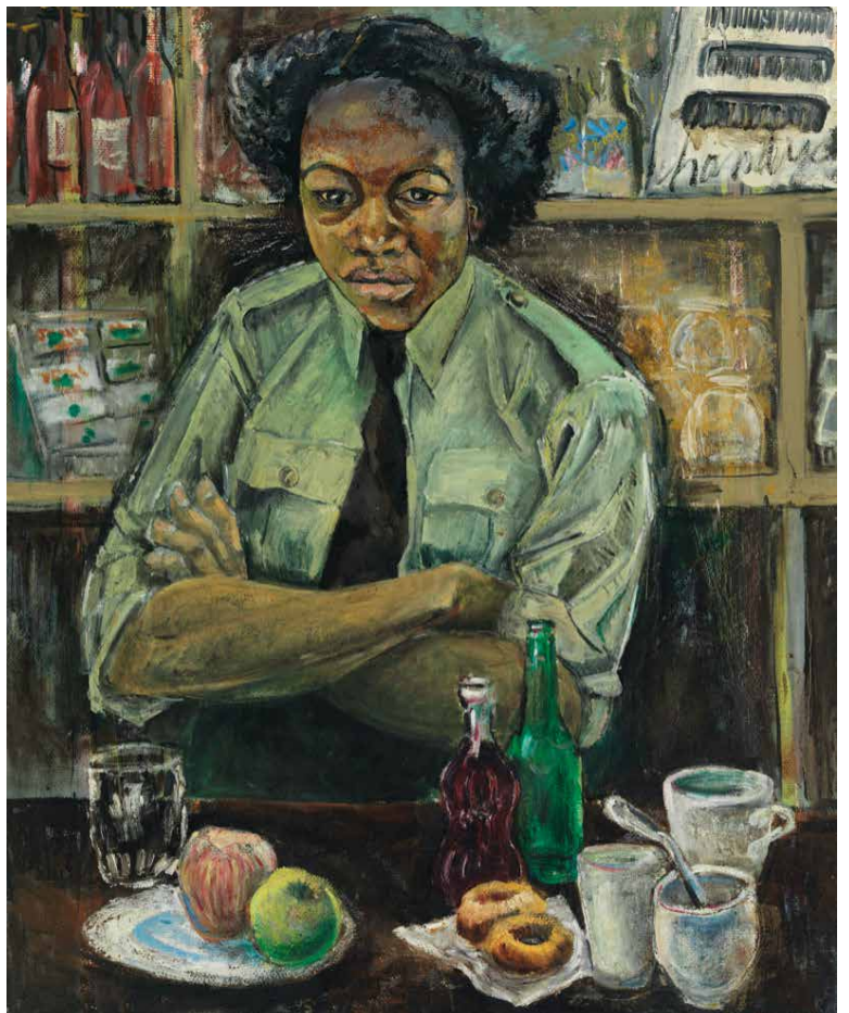
Peinture de Molly Lamb Bobak, 1946 Première femme nommée artiste de guerre au sein de l'armée canadienne